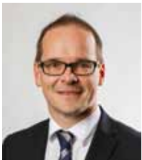
Грант Хендрік Тонне Міністр культури Нижньої Саксонії

На цій основі Ви зможете прийняти обґрунтоване рішення щодо подальшого освітнього шляху Вашої дитини. Спільною метою має бути щаслива дитина, яка мотивована відповідати вимогам обраного типу школи.